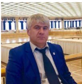
Председатель координационного Совета НКО Республики Дагестан, Руководитель исполкома в ДРО ООО "Российский Союз ветеранов"