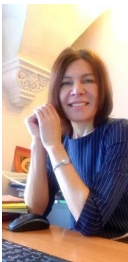
Доктор философских наук, кандидат политических наук, руководитель отдела государственной культурной политики Российской